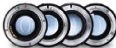
ZE ZF.2 ZF ZK