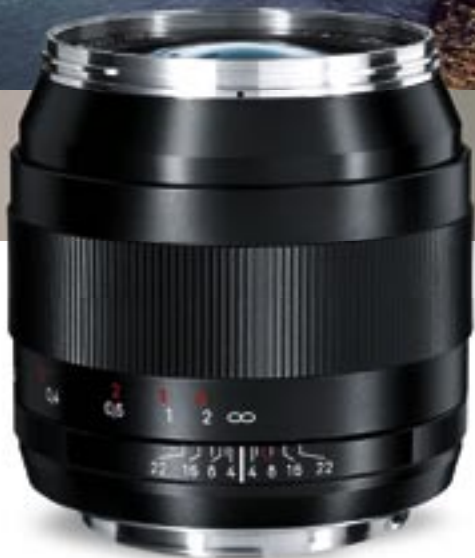
Abbildung zeigt ZE-Anschluss