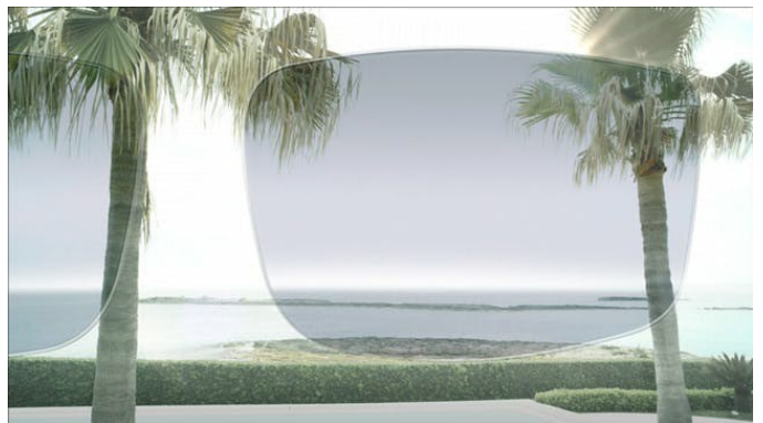
Noch besser sind selbsttönende Brillengläser, denn sie passen sich wechselnden Lichtverhältnissen automatisch an.

Selbsttönende Brillengläser bieten Ihnen Komfort. Sie passen sich automatisch wechselnden Lichtverhältnissen an. Dies kann für Sie interessant sein, wenn Sie häufig zwischen verschiedenen Beleuchtungssituationen – drinnen und draußen – wechseln und Ihre Brillen nicht austauschen möchten oder können. Zudem ist es möglich, Ihre Brillengläser mit einem Polarisierungsfiler auszustatten. Dieser vermeidet Blendungen und Spiegelungen beispielsweise beim Autofahren auf regennasser Straße bei Sonnenlicht.