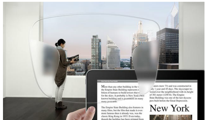
Hoch individuelle Gleitsichtgläser von ZEISS.

Zunächst sind da die einfachen sphärischen Gläser (3-Sterne-Qualität), bei denen Verzerrungen auftreten und die die Augen des Brillenträgers vergrößern.