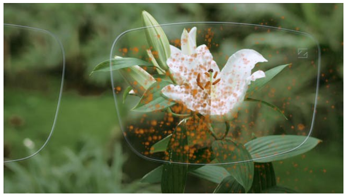
Der Blütenstaub auf der rechten Hälfte des Glases haftet auf Grund einer antistatischen Schicht nicht an, so dass Ihre Brille nicht so schnell verschmutzt.

Nun kommen wir zu den Extras, mit denen Sie Ihre Präzisionsbrillengläser noch weiter optimieren können. Wollen Sie in eine leistungsstarke Beschichtung investieren? Sie können sich beispielsweise für Beschichtungen entscheiden, durch die Ihre Brillengläser noch härter und kratzfester werden, oder für eine entspiegelnde Beschichtung. Darüber hinaus gibt es antistatische oder Schmutz und Wasser abweisende Beschichtungen. Ihr Vorteil: Qualitativ hochwertige Beschichtungen verhelfen Ihnen zu einer jederzeit klaren und unvernebelten Sicht. Zudem lassen sich beschichtete Brillengläser leichter reinigen. Die Entscheidung liegt bei Ihnen.